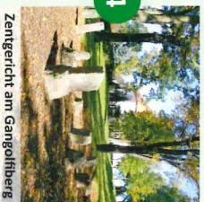
Zentgericht am Gangolfberg