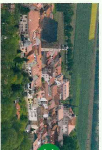
Blick auf Geisa