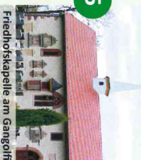
Friedhofskapelle am Gangolfberg