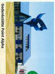
Gedenkstätte Point Alpha