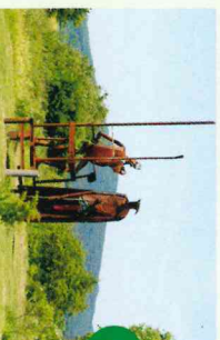
Skulpturenweg „Weg der Hoffnung“