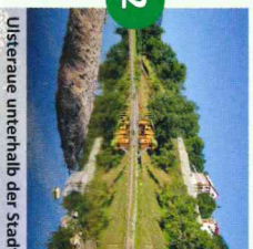
Ulsteraue unterhalb der Stadt