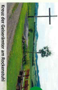
Kreuz der Geiseräimer am Rockenstein